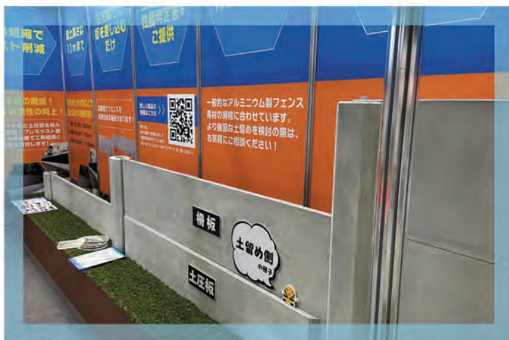
↑3種類の地上高さ(300mm~1100mm)の柱をすべて展示!土圧板の厚みもアピールしました。