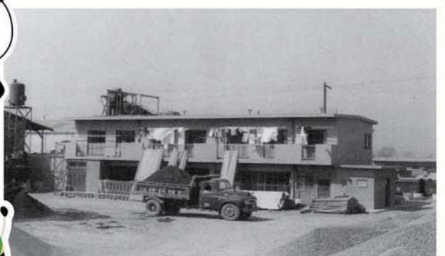
↑ 昭和40年 鉄工場完成

独身寮と鉄工場はまだ社内には存在しています！ 上の昭和30～40年代と思われる写真ですが、 当時は炎天下で作業していたという事でしょうか.. 他にも、昔の写真が大きなパネルになって、 府中本社や葛飾SCに展示されています！