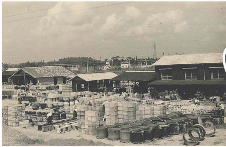
↑ 昭和30～40年代？ 工場風景 →

今回は、会社の地下倉庫から多くの写真が発見されたので、歴代の代表取締役と共に ご紹介したいと思います！