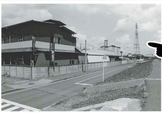
← 昭和60年代 多摩川土手から工場西部分

↑ 25年くらい前の現社長 都築 親司 都建材工業の草野球チームにて。現在も草野球チームはあります！