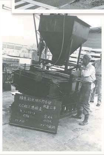
昭和51年 材料検査の様子