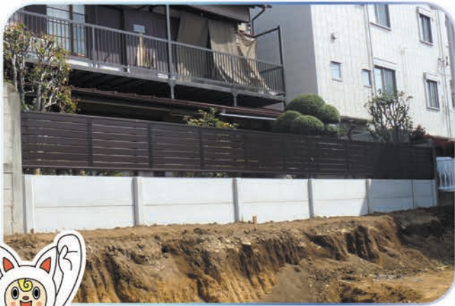
住宅地の境界として

製品の正式発売から間もないフェンスウォールフラットですが、おかげさまですでに沢山の現場で採用されました。ホームページにてより多くの事例を御覧頂けます！