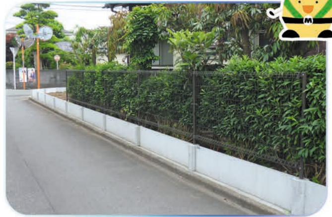
フラット【小】(地上高さ 300mm)