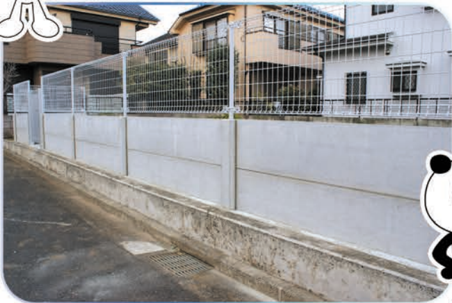
住宅地にて施工、府中本社から近く見学可能。