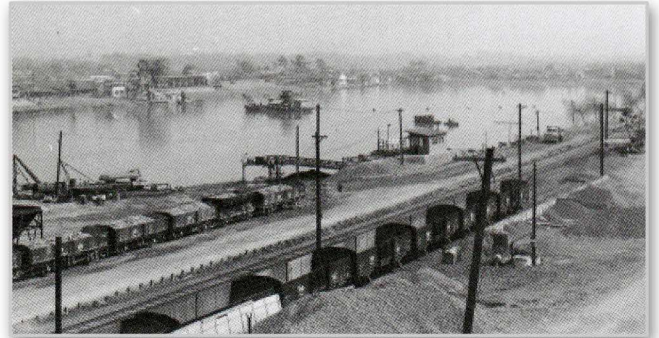
昭和37年 多摩川競艇場