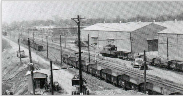
昭和30年代 多摩川線

前回、みやこ通信で都建材創業当時の写真を紹介させていただきましたがありがたい事に予想以上の反響をいただきました。やはり古い写真で興味深いですね。今回は昭和30年代の都建材や西武多摩川線の様子を掲載します。